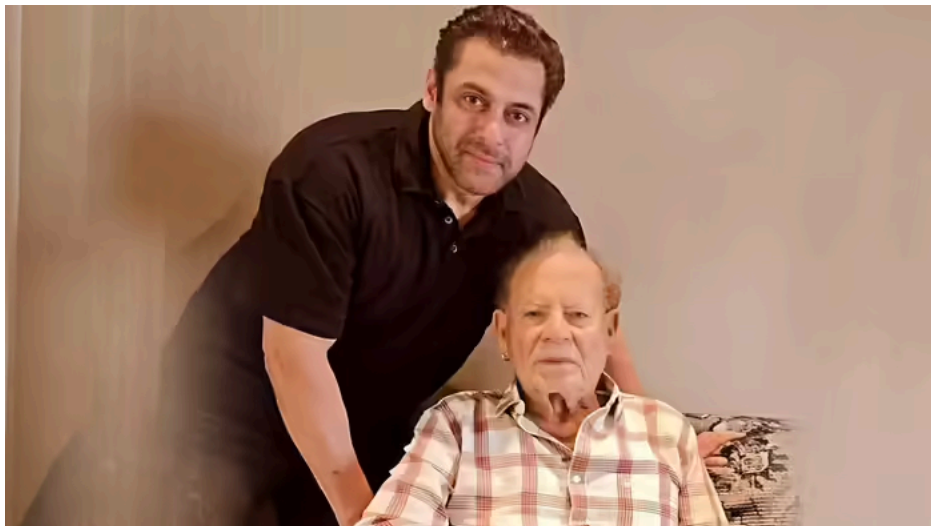
सलमान के पिता सलीम खान अस्पताल से डिस्चार्ज, 1 महीने बाद मिली छुट्टी, हुआ था ब्रेन हैमरेज: रिपोर्ट

सलमान खान के पिता सलीम खान को लीलावती अस्पताल से एक महीने बाद डिस्चार्ज कर दिया गया है। खबर है कि 17 मार्च की सुबह साढ़े 10 बजे उन्हें डिस्चार्ज किया गया। वह 17 फरवरी से अस्पताल में भर्ती थे।